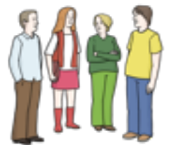
Kirche sind Menschen.