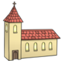
Kirche ist ein Haus.