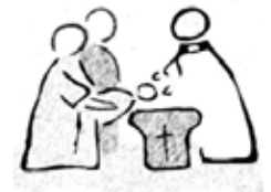
Die Taufe heißt für Christen: Gott will bei Dir sein. Lass in Deinem Leben Platz für Gott.