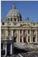
Katharina Kasper wird in Rom heilig gesprochen.