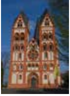
Katharina spricht mit dem Bischof von Limburg.